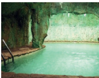
El Teularet www.teularet.com