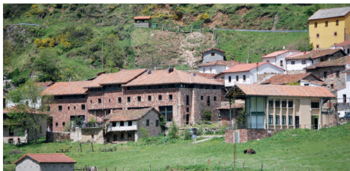
La Hostería del Huerna www.hosteriadelhuerna.es