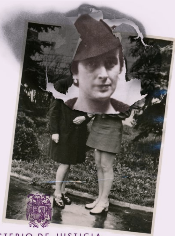
MINISTERIO DE JUSTICIA PATRONATO DE PROTECCION A LA MUJER