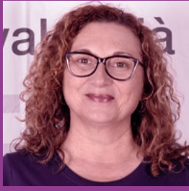
Xelo Valls SG FE CCOO PV