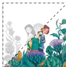
4. Les detectives i el banquet de carxofa Aina Garcia Carbó LA CARXOFA