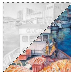
9. Després de les mareas Ivan Carbonell Iglesias EL LLAGOSTÍ