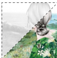
2. Ah!, bella reina... Mercè Climent LA MEL