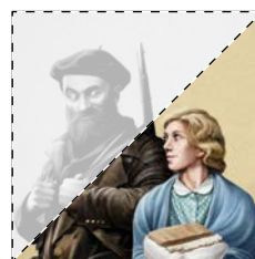
5. La dolçor del món Francesc Gisbert L'AMETLA