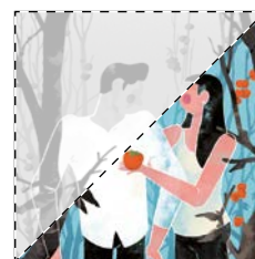
6. Un pont de plata Miguel Puig EL CAQUI